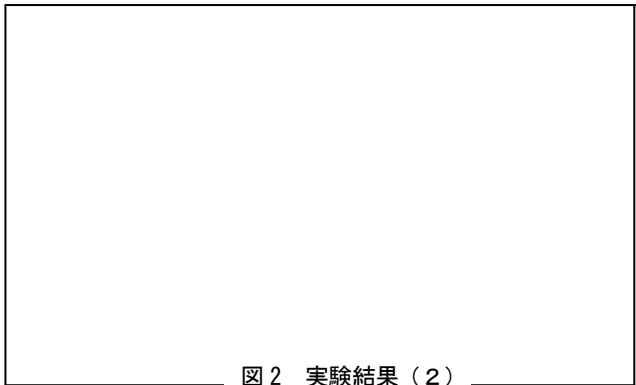
図 2 実験結果(2)